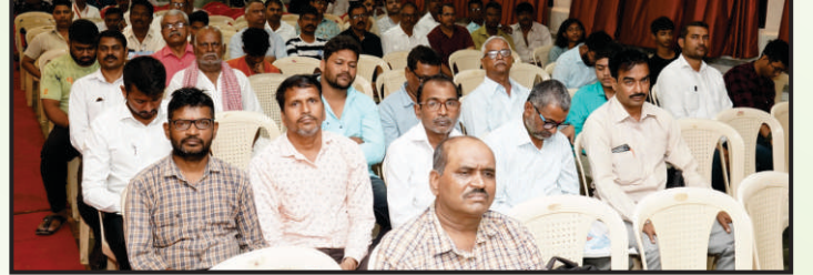
22 व्या वार्षिक सर्वसाधारण सभेस उपस्थित सभासद वर्ग