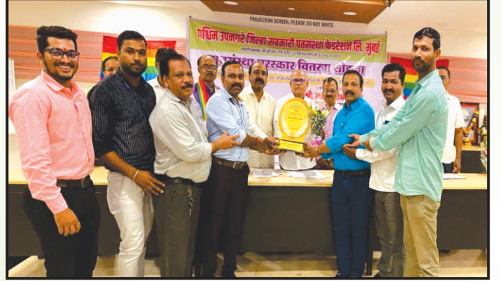
पश्चिम उपनगरे जिल्हा सहकारी पतसंस्था फेडरेशन मर्यादित, मुंबई यांच्यावतीने सन 2022-23 या आर्थिक वर्षाच्या गट क्र.5 मधून 50 ते 100 कोटीपर्यंत ठेवीमध्ये 'प्रथम पुरस्कार' स्वीकारताना संस्थेचे मुख्यकार्यकारी अधिकारी व इतर अधिकारी वर्ग.