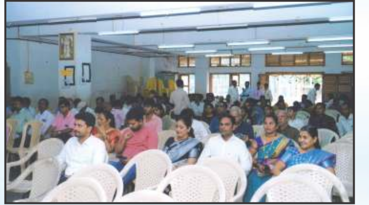
21 व्या वार्षिक सर्वसाधारण सभेस उपस्थित असलेले सभासद.