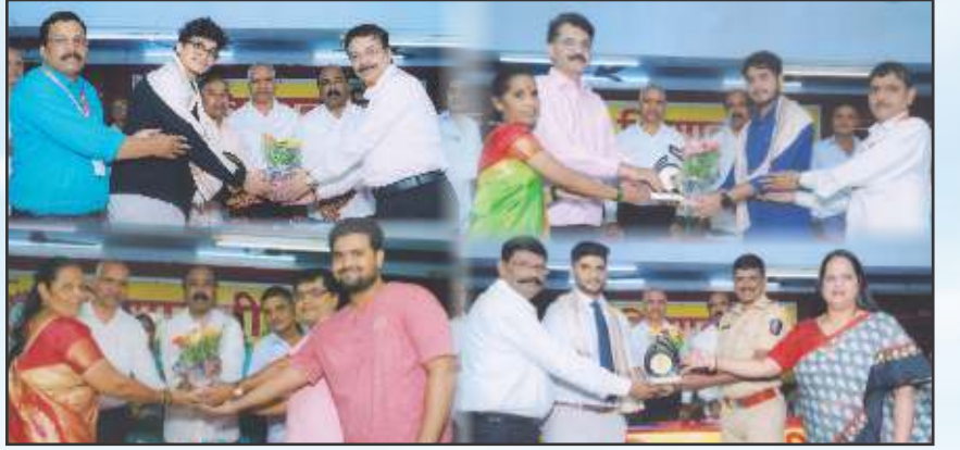
21 व्या वार्षिक सर्वसाधारण सभेत शैक्षणिक क्षेत्रात उल्लेखनीय कामगिरी केल्याप्रसंगी पदवीधर विद्यार्थी व पालकांचा सन्मान करताना संस्थेचे संचालक मंडळ व प्रमुख पाहुणे.