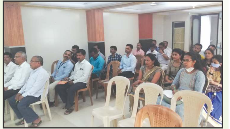
दि. 19/3/2022 ते 21/03/2022 रोजी महाराष्ट्र राज्य सहकारी संघ, पूर्णे यांच्यातर्फे घेण्यात आलेल्या प्रशिक्षण वर्गास उपस्थित संचालक मंडळ व कर्मचारी वर्ग.