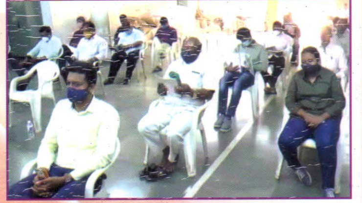
19 व्या वार्षिक सर्वसाधारण सभेस उपस्थित सभासद वर्ग